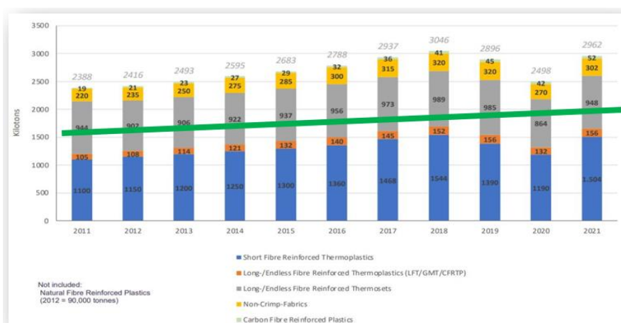
Obrazok.2: Produkcia kompozitných materiálov v Európe

Hlavné výhody bazaltu (čadiča): je to najrozšírenejšia magmatická hornina na Zemi s výnimočnými fyzikálnymi vlastnosťami: